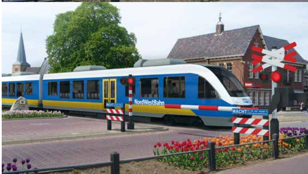
Regiotram of regionale trein in Groesbeek.

en baten kan verwachten gedurende meerdere jaren. Vervolgens is de vraag of de betrokken partijen de tekorten willen bijpassen.